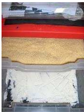
des bacs pour laisser des traces