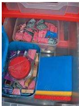
tampons, supports à frotter